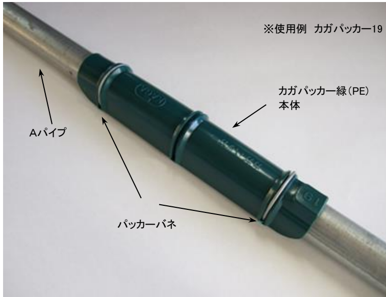
※使用例 カガパッカー19