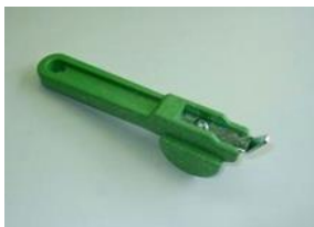
パッカープーラー 規格表

パッカープーラー パッカー1箱に1個サービス中 パッカー ロールパッカー1箱に1個サービス中 カガパッカーを取り外す専用道具です。 ロールパッカーを取り外す専用道具です。