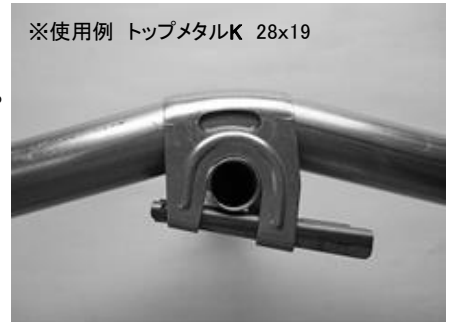
※使用例 トップメタルK 28x19

傾斜角度につきましては、ハウスの強度の面から、雪等に強く30度が理想の角度と考えております。